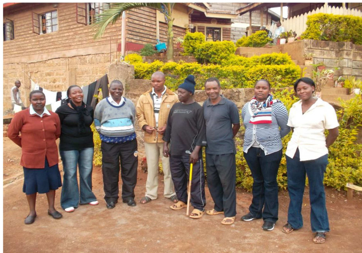
Hier sieht man die Mitarbeiterin des Zentrums